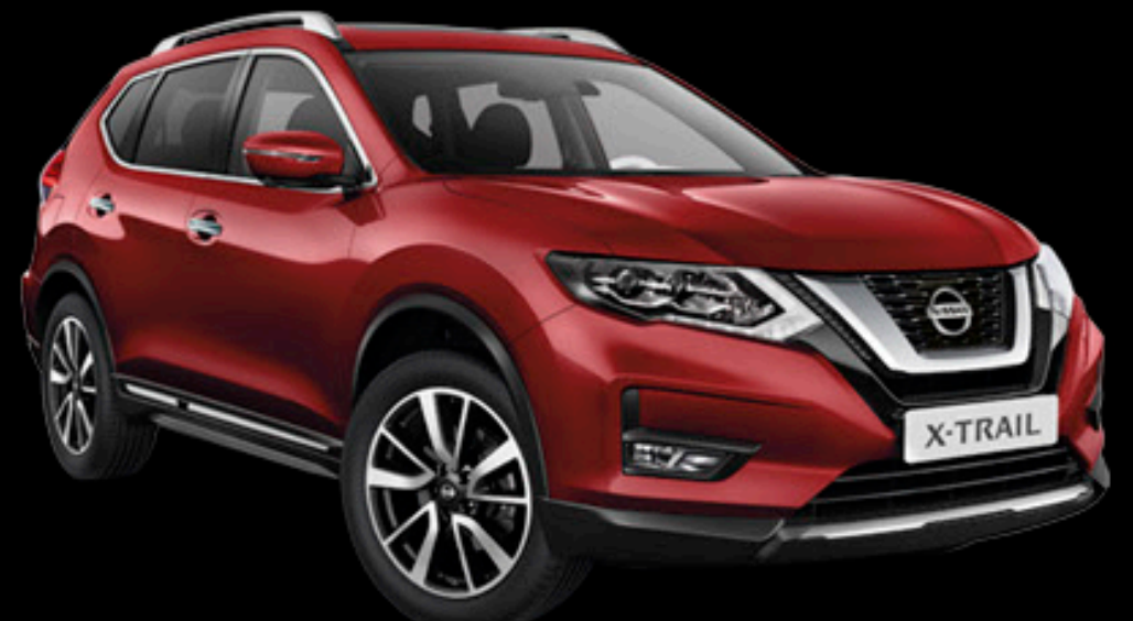
ROJO TITANIO (METÁLICO)