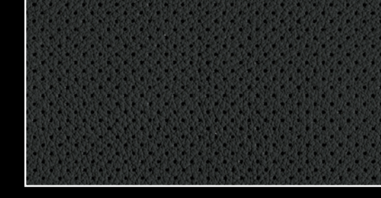
NEGRO GRAFITO / CUERO

Características y especificaciones sujetas a cambios. Por favor consulta con tu distribuidor.