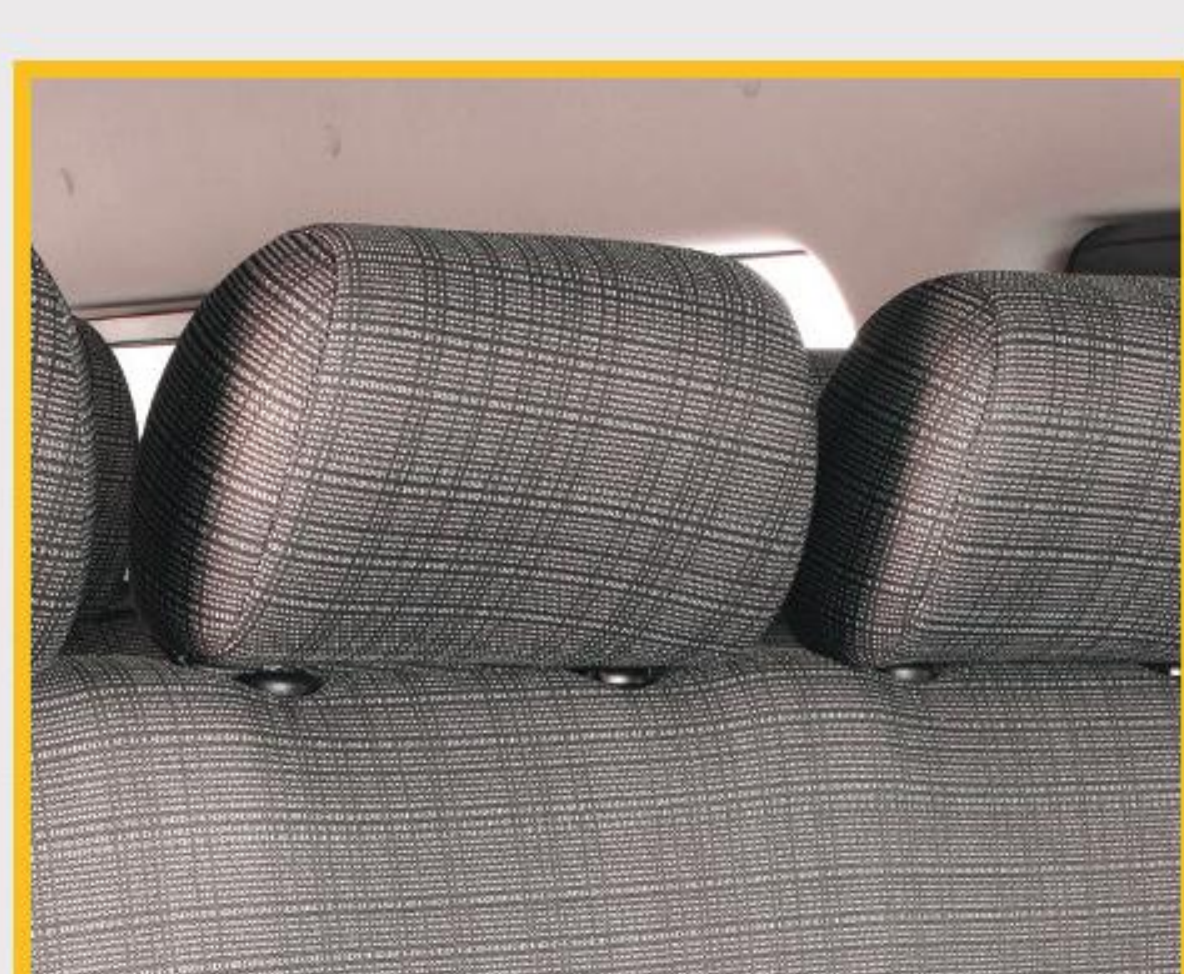
Asientos con apoya cabeza