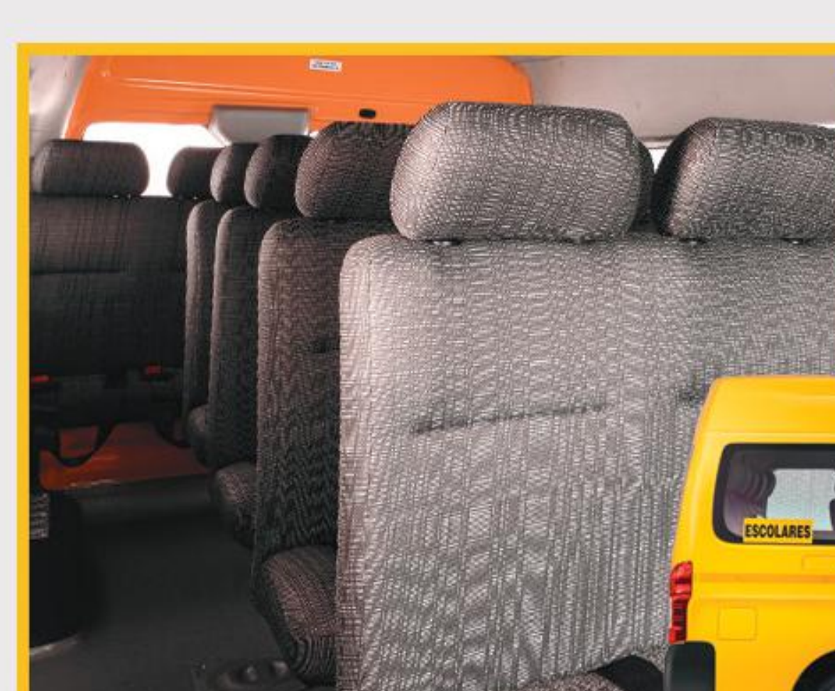
Capacidad 24 pasajeros